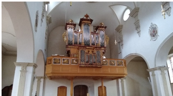
Die Bergöntzle-Organ in Tschagguns.