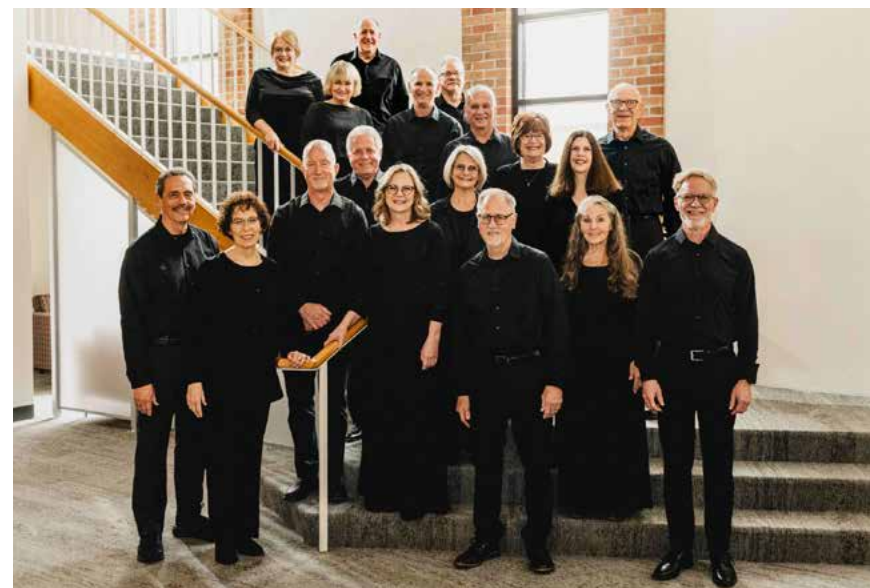
Wooddale Chamber Choir

Unter dem Titel „Klangfarben – Von Himmel bis Hollywood“ spannt s'Chörle einen weiten Bogen von Filmmusik über Gospelstücke und religiöse Lieder bis hin zu Pop-, Rock- und Evergreen-Melodien. So entsteht ein facettenreicher Abend, der zum Innehalten und Mitschwingen einlädt. Im Anschluss sind alle Gäste herzlich eingeladen, den Abend auf dem Kirchenvorplatz bei einem gemütlichen Beisammensein mit Grill ausklingen zu lassen. Der Eintritt ist frei. Der Chor freut sich über Spenden.