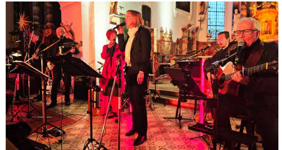
Benefizkonzert im April: evangelische Band in voller katholischer Kirche, stehender Applaus und 3125 € für das Kirchendach von St. Georg